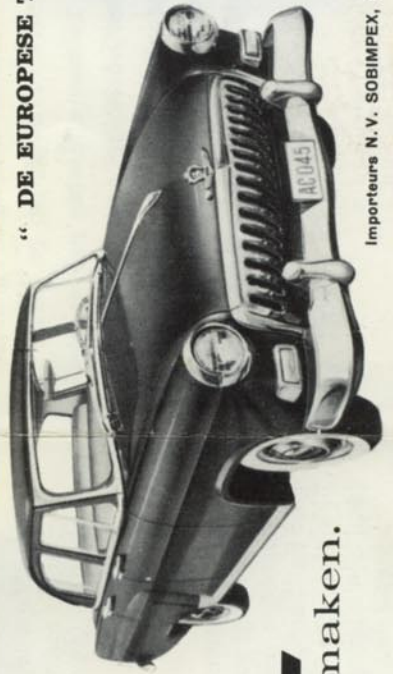
" DE EUROPESE TOP KLASSE " 6-ZITTER " WAGEN !

Handrem : mechanisch, werkend op een trom- mel aan de uitgang van de versnellingsbak; controlelampje op het instrumentenbord.